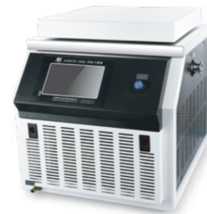
SCIENTZ-10ND 钟罩式冻干机系列